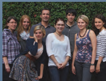
KU Gruppen - Leiter