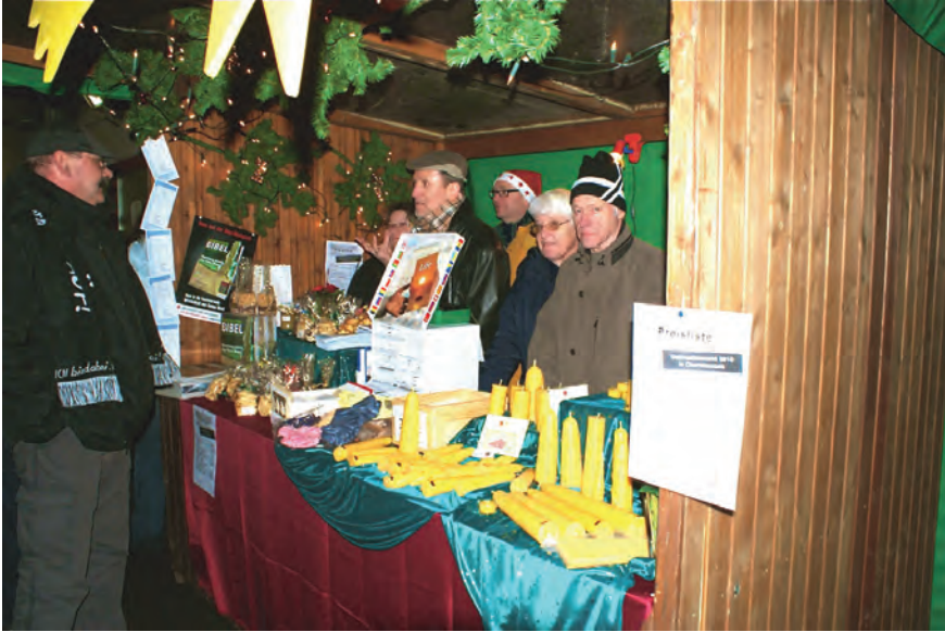
Weihnachtsmarkt 2010; Bild: Ralf Richter

wieder sein: Am 3. Adventswochenende (10. / 11. Dez.) lädt der Vereinsring – und wir als Evangelische